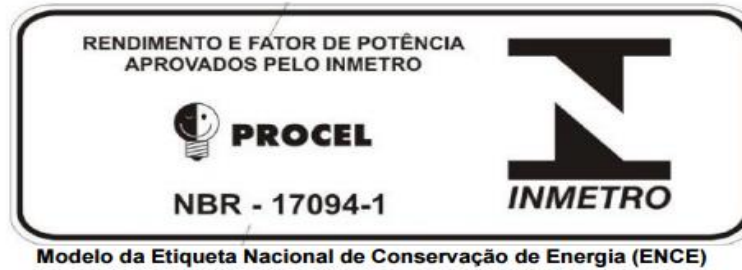
Figura 1 – Modelo da Etiqueta ENCE