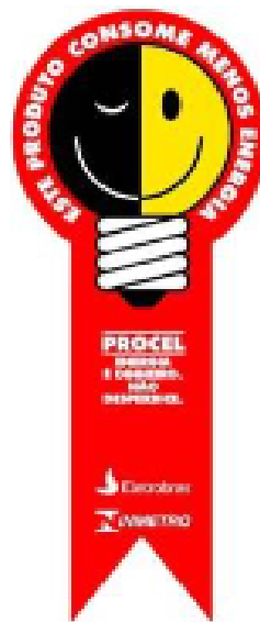
Figura 2 – Selo PROCEL

O Selo PROCEL será exigido para motores novos da categoria IR2.