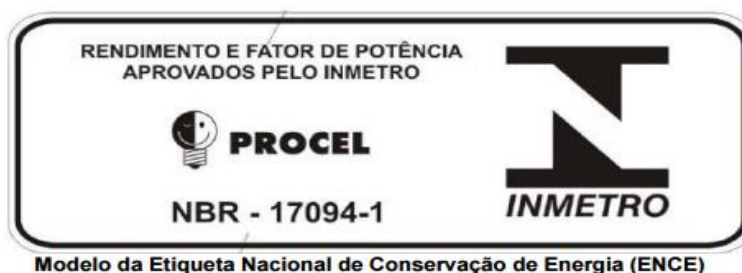
Figura 1 – Modelo da Etiqueta ENCE